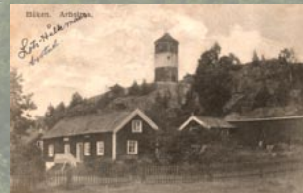
Ur författaren Arholma Kalles sjömanskista. Vykort. Lots-Hållermans bostad nedanför Båkberget.