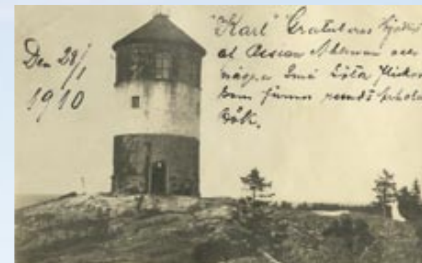
Ur författaren Arholma Kalles sjömanskista. Vykort från Ossian Ahlman till Arholma Kalle 1910.

NEDANFÖR BÅKEN där de tidigare lotsboställena låg står idag en av Arholmas gamla seglande lotsbåtar uppställd i sitt båthus.